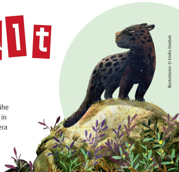
Illustrationen © Emilia Dzibak